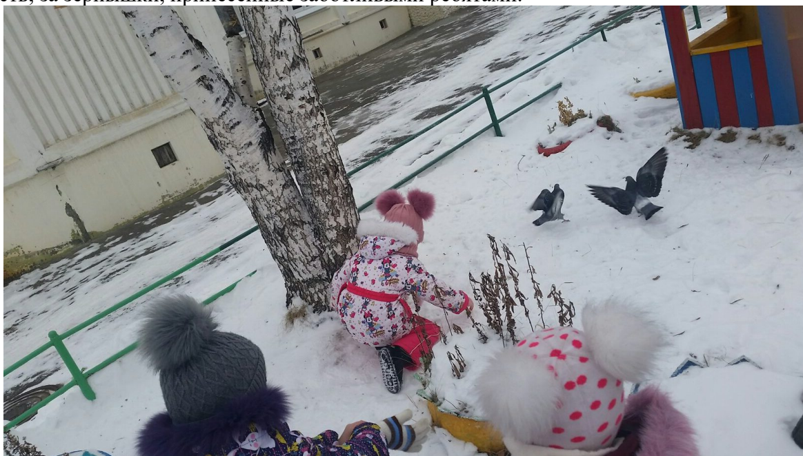
Воспитанник группы «Барбарики» кормят птиц.

Птицы ждут прихода ребят и позволяют наблюдать за собой, наверно в благодарность, за зёрнышки, принесённые заботливыми ребятами.