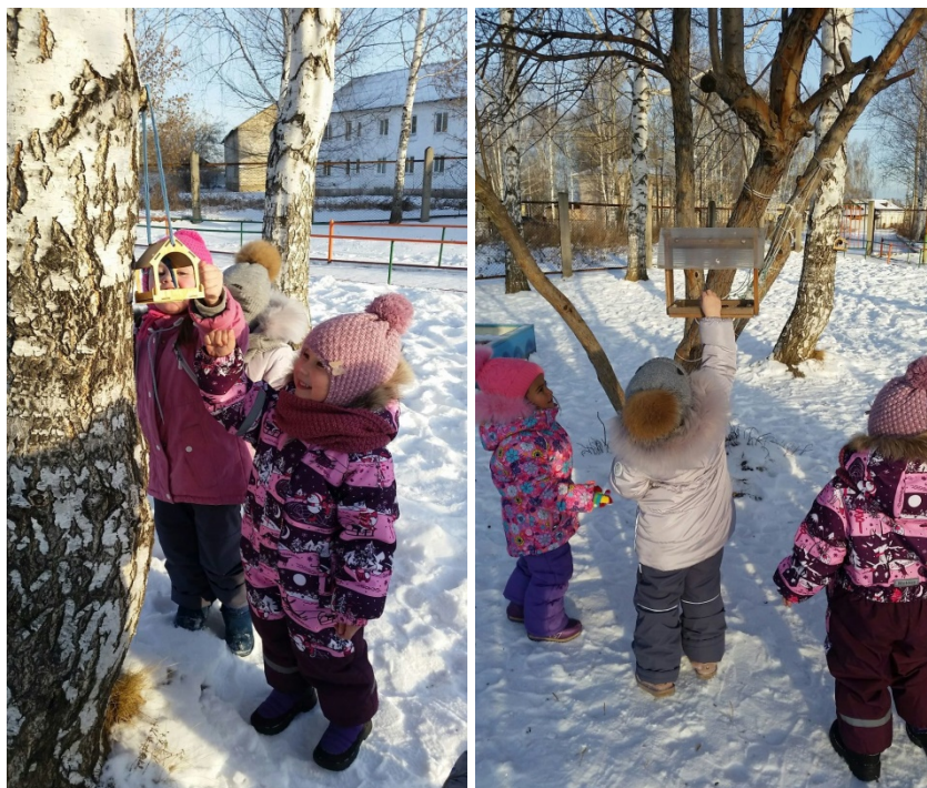
Акция «Птичья столовая»

Птицы ждут прихода ребят и позволяют наблюдать за собой, наверно в благодарность, за зёрнышки, принесённые заботливыми ребятами.