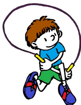
Рис. 5. Скрестные вращения скакалкой

После освоения подготовительных упражнений переходят к серийному выполнению двойных прыжков, вращая скакалку вперед и назад. Затем осваивают одинарные прыжки и прыжки на одной ноге. Постепенно прыжки разнообразят и усложняют, используя для этого различные исходные положения, переводы скакалки, повороты, передвижения и др., вращая скакалку вперед, назад, скрестными вращениями (петлей) назад и вперед (рис. 5).