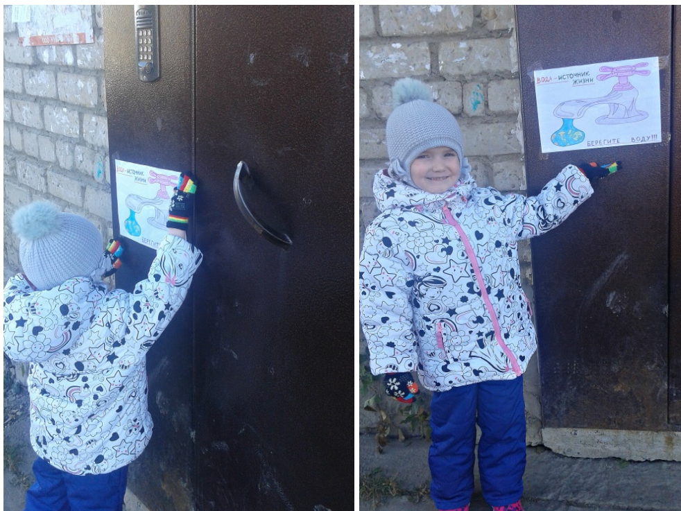
Акция «Берегите люди воду»

Экологические акции необходимы и как нельзя лучше подходят для формирования активной жизненной позиции детей по отношению к окружающей среде. Являются одной из активных форм работы по экологическому воспитанию дошкольников.