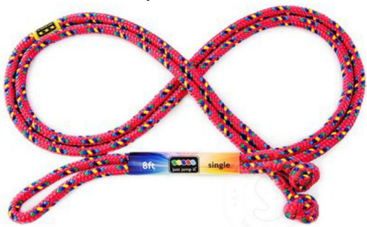
Рис. 3. «Восьмерка»

Добавьте к круговому вращению скакалкой еще приставной шаг ногами. Это упражнение позволяет привыкнуть к скакалке, а также разогреет мышцы. Такой вид деятельности со скакалкой называется «активный отдых».