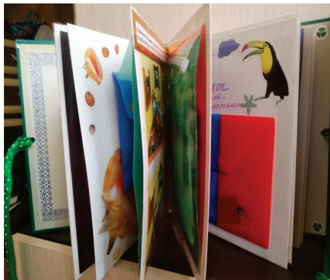
ЛЭПБУК «АЗБУКА ПЕШЕХОДА»