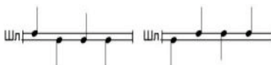
Рисунок 4. - Ритмический рисунок для выполнения отдельных ударов каждой рукой в чередовании