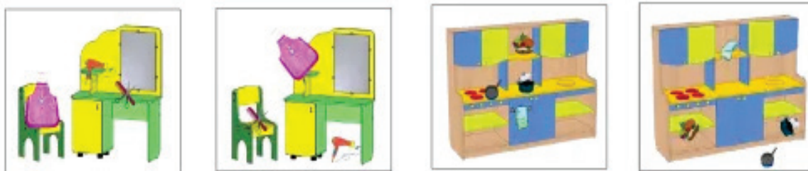
Рис. 1 Дидактическая игра «Правильно-неправильно»

строгий порядок их выполнения, создавая алгоритм. В процессе приучения дошкольников к выполнению гигиенических норм, каждое действие должно быть поэтапно объяснено, обращая внимание на способы его выполнения. Для усиления эффекта можно использовать наглядные материалы, такие как картинки и плакаты, дидактические игры.