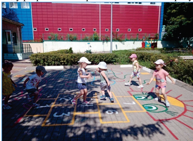
Рисунок 1. «Решетчатые классики».

В нашем детском саду разработаны игры с использованием рисунков на асфальте