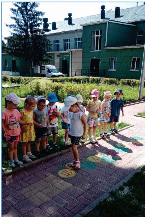
Рисунок 5. «Гусеница» 4-7 лет). В игре «Гусеница» можно посоревноваться в паре, прыгая по цифрам, а также со всеми вспомнить цифры и прямой или порядковый счет.

Рисунок 4. «Путаница» (4-7 лет). Игра «Путаница» помогает закрепить знание основных цветов, координацию движений, умение уступать дорогу другу-сопернику на перекрестке линий