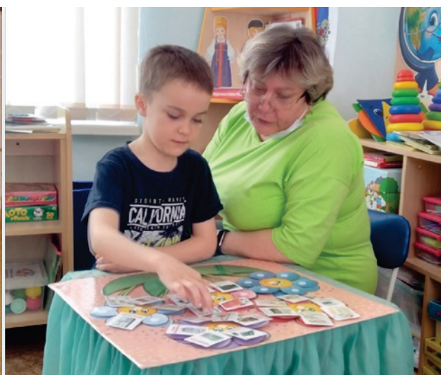
Дидактические игры по теме. «Птицы»