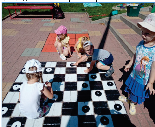
Рисунок 2. «Шашки». (5-7 лет) Шашки – это и наука, и спорт, и искусство в одной игре, доставляющее много удовольствия и радости. Игра в шахматы расширяет кругозор, учит думать, быть внимательным, запоминать, сравнивать, обобщать, предвидеть результаты своей деятельности. Развивает изобретательность и логическое мышление.

(5-7 лет) В «Решетчатых классиках» прыгают одной и двумя ногами попеременно - одна, одна, две, одна две, одна, две, поворот и обратно.