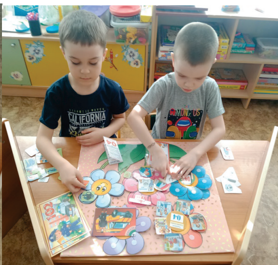
Дидактические игры по теме: «Бытовая техника»