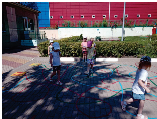
Рисунок 4. «Не ошибись!» (4-7 лет). Все дети передвигаются враспынную, выполняя задания ведущего. Ведущий говорит название цветка – дети стараются правильно найти и встать на нарисованный на асфальте цветок. Игра продолжается – ведущий называет другие цветы.

Рисунок 3. «Крестики - нолики» (5-7 лет) Необходимо собрать 3 символа в трех направлениях: горизонтально, вертикально, по диагонали. Игра рассчитана на двух человек. Сначала обговаривается, кто каким символом будет играть: крестиком или ноликом. Затем дети поочередно ставят свои знаки так, чтобы в итоге получилась линия их трех крестиков или трех ноликов.