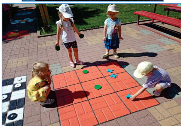
Рисунок 3. «Крестики - нолики» (5-7 лет) Необходимо собрать 3 символа в трех направлениях: горизонтально, вертикально, по диагонали. Игра рассчитана на двух человек. Сначала обговаривается, кто каким символом будет играть: крестиком или ноликом. Затем дети поочередно ставят свои знаки так, чтобы в итоге получилась линия их трех крестиков или трех ноликов.

Рисунок 4. «Не ошибись!» (4-7 лет). Все дети передвигаются враспынную, выполняя задания ведущего. Ведущий говорит название цветка – дети стараются правильно найти и встать на нарисованный на асфальте цветок. Игра продолжается – ведущий называет другие цветы.