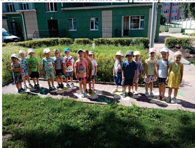
Рисунок 6. «Кто быстрее?» (4-7 лет). В эстафете участвуют две-четыре команды. (по количеству нарисованных на асфальте рисунков)

Рисунок 5. «Гусеница» 4-7 лет). В игре «Гусеница» можно посоревноваться в паре, прыгая по цифрам, а также со всеми вспомнить цифры и прямой или порядковый счет.