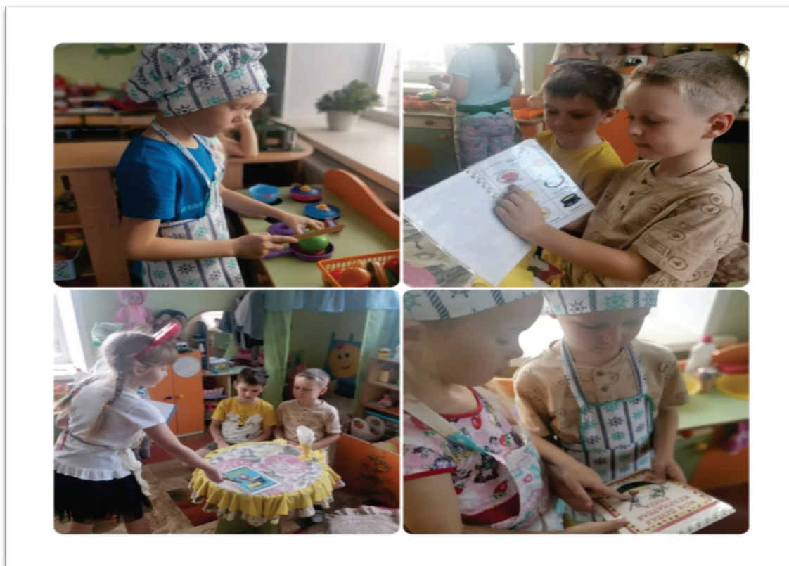
Рисунок 1. Сюжетно-ролевая игра «Кафе»

Таким образом, на основе теоретического материала, мы делаем вывод, что сюжетно-ролевая игра детей старшего школьного возраста помогает детям не только развивать фантазию, сопереживать участникам игры, проявлять творческий подход, но и помогает социализироваться в обществе, научиться выстраивать отношения со сверстниками, помогать друг другу, а также поддерживать.