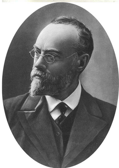
Дубовский Николай Никанорович (1860 - 1918)