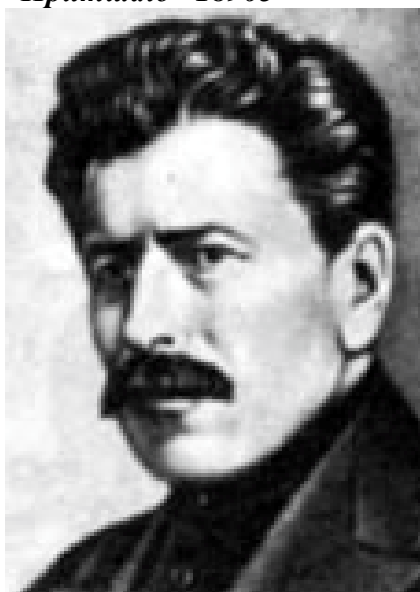
Греков Митрофан Борисович (1882- 1934)