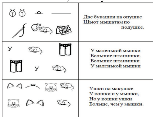
Автоматизация звука [Ш]

Знаки и символы, используемые в мнемотаблицах, должны быть хорошо знакомы детям.