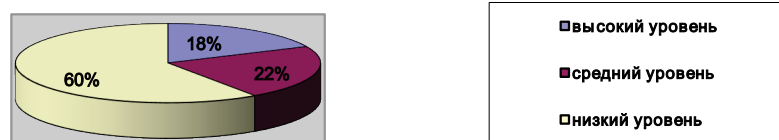
Диаграмма уровня сформированности интереса к книге и чтению на входном этапе: