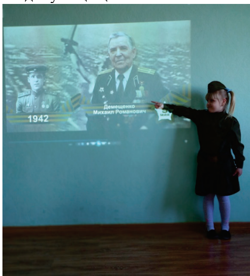
Герои нашей страны.