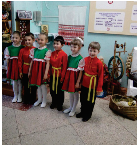
Пение русских народных песен.