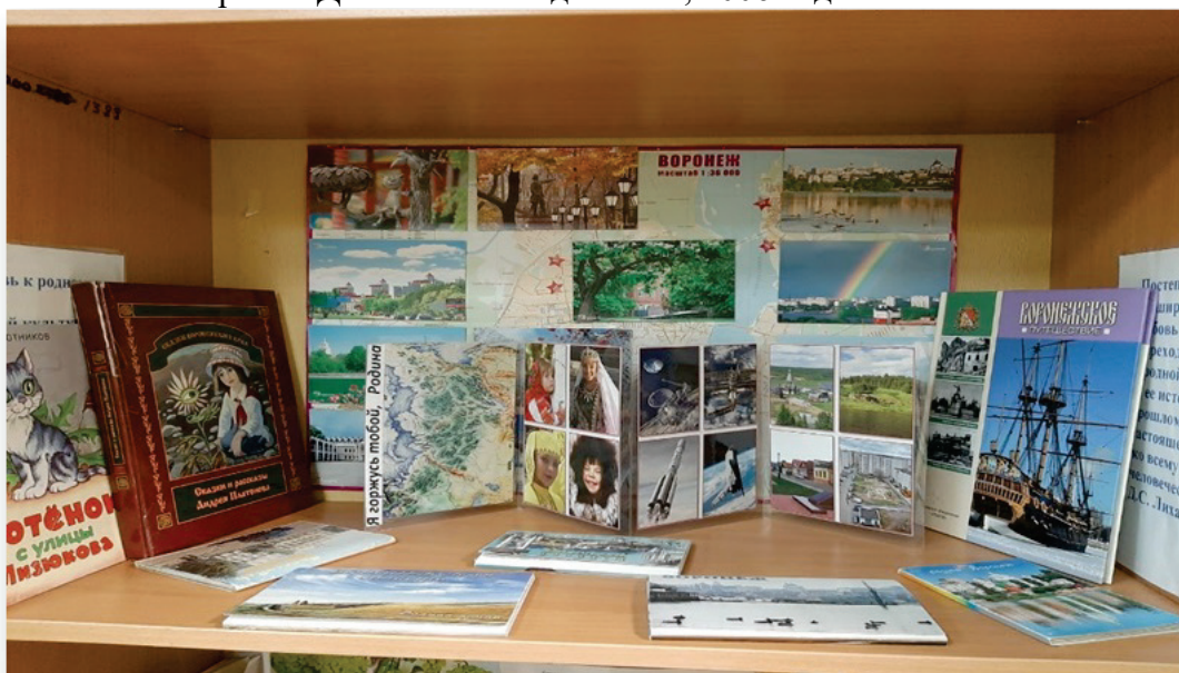
Центр патриотического воспитания