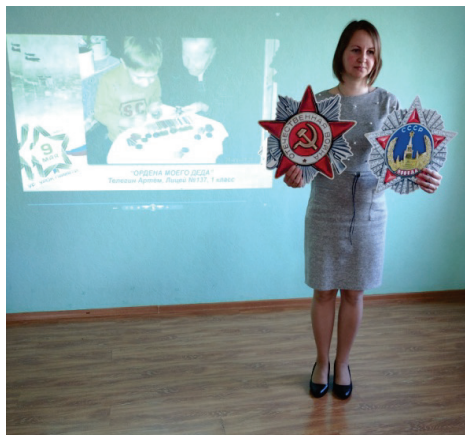
Беседа «Есть такая профессия – Знакомство детей с орденами ВОВ. Родину защищать!»