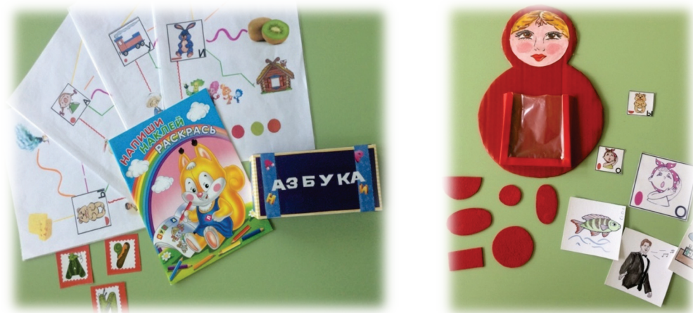
Выставка детской книги «Азбука»