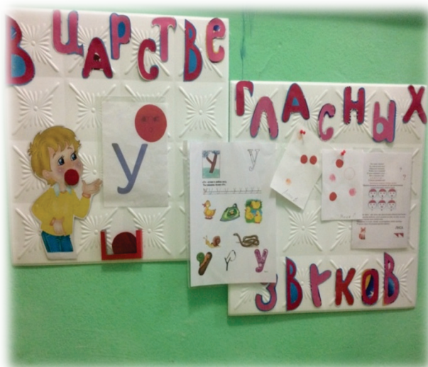
Информационный стенд «В царстве гласных звуков»