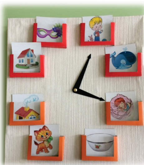
Дидактическая игра «Звуковые часы»