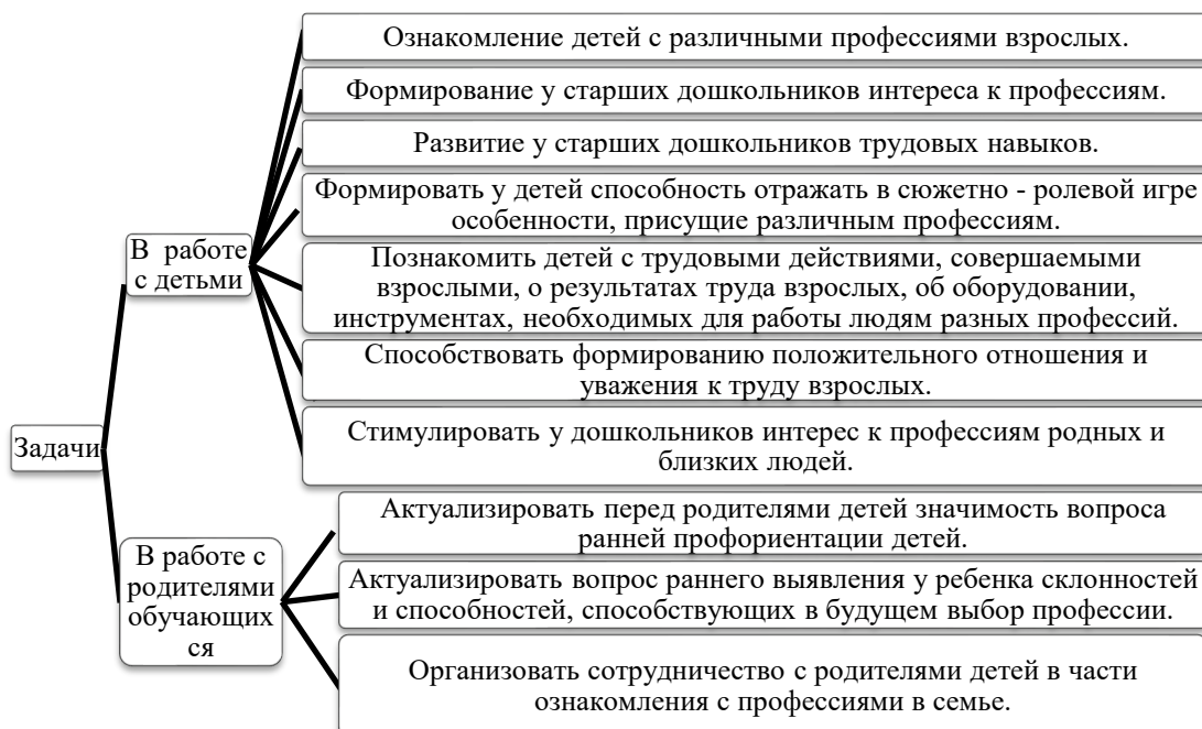
Рис. 1. Задачи по формированию у детей дошкольного возраста представлений о профессиях посредством сюжетно-ролевых игр

В соответствии с поставленной целью нами решались следующие задачи (рис.1):