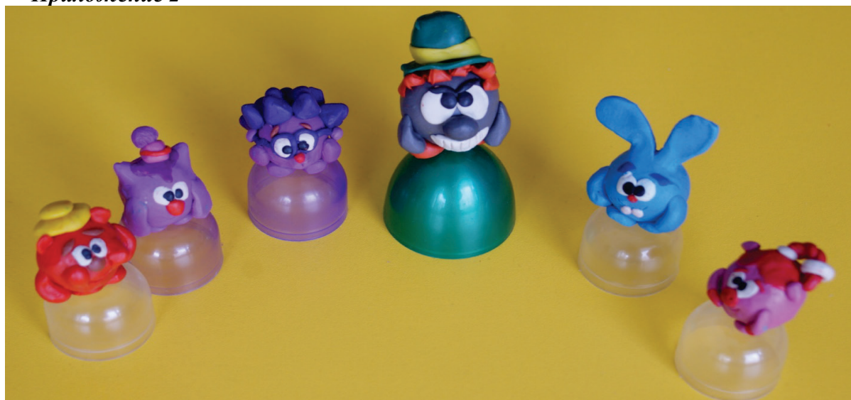
Фишки для игры