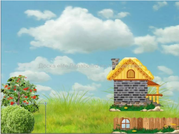
Перила, чердак, чердачное окно, порог