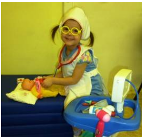
«Дышите, не дышите»