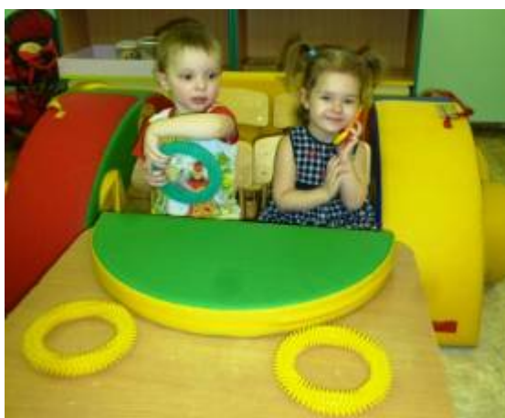
Едем на машине