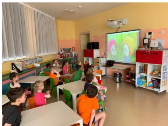
Знакомимся с Эколятами