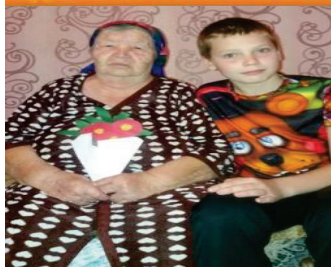
Акция «Поздравь учителя»