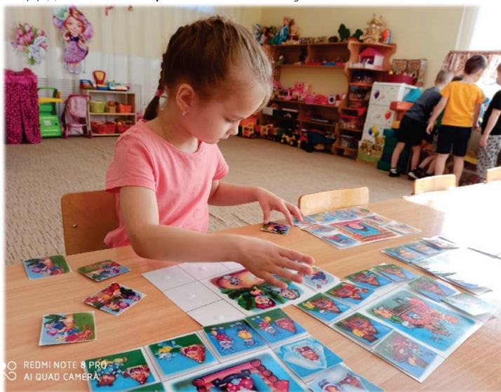
Дидактическая игра «Угадай профессию»