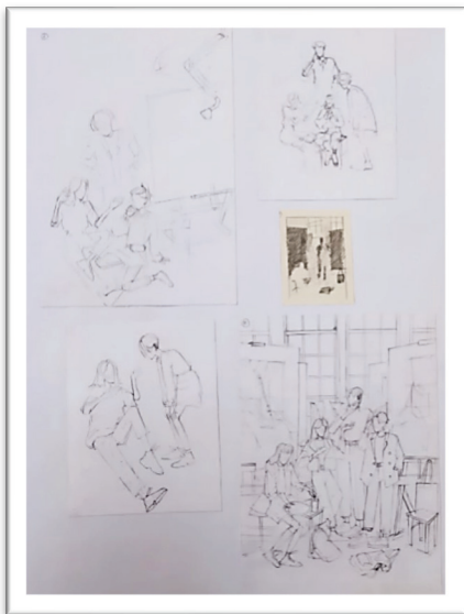
Рис.1. Разработка линейного эскиза композиции. Автор С. Мария