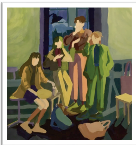
Рис. 4,5. Разработка вариантов цветowych эскизов композиции. Автор С. Мария