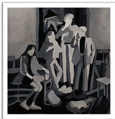
Рис.2, 3. Разработка вариантов тональных эскизов композиции. Автор С. Мария