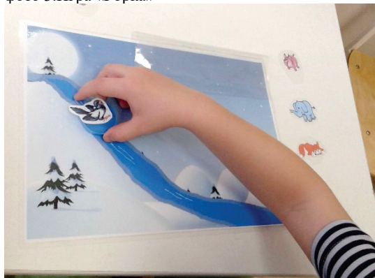
фото 4. Панно «Помоги пчелке Майе»