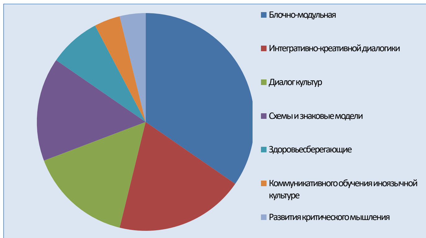
Рис. 1. Технологии реализуемые в ГБПОУ РО «ЗимПК»

Процентное соотношение реализуемых в Зимовниковском педагогическом колледже технологий представлено на Рис 1.